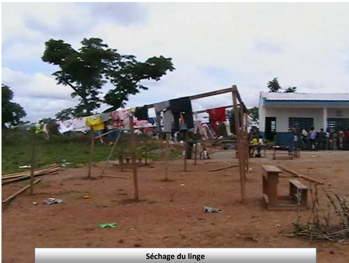
Séchage du linge

Pour le lavage des mains et le bain, chaque ménage doit disposer d'en moyenne 02 récipients de lavage des mains et de deux seaux ou bassines de 15 litres en moyenne pour le bain. La distribution sera assurée par l'équipe d'ASOL en collaboration avec la section socio communautaire de la FICR et de l'UNHCR. Une évaluation préalable des besoins par ménage permettra d'assurer une distribution équitable des récipients.