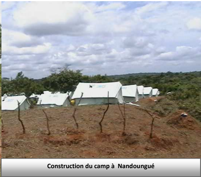
Construction du camp à Nandougué