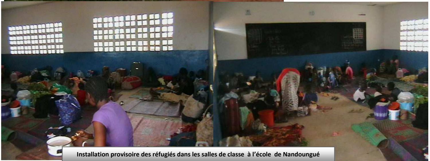
Installation provisoire des réfugiés dans les salles de classe à l'école de Nandougué