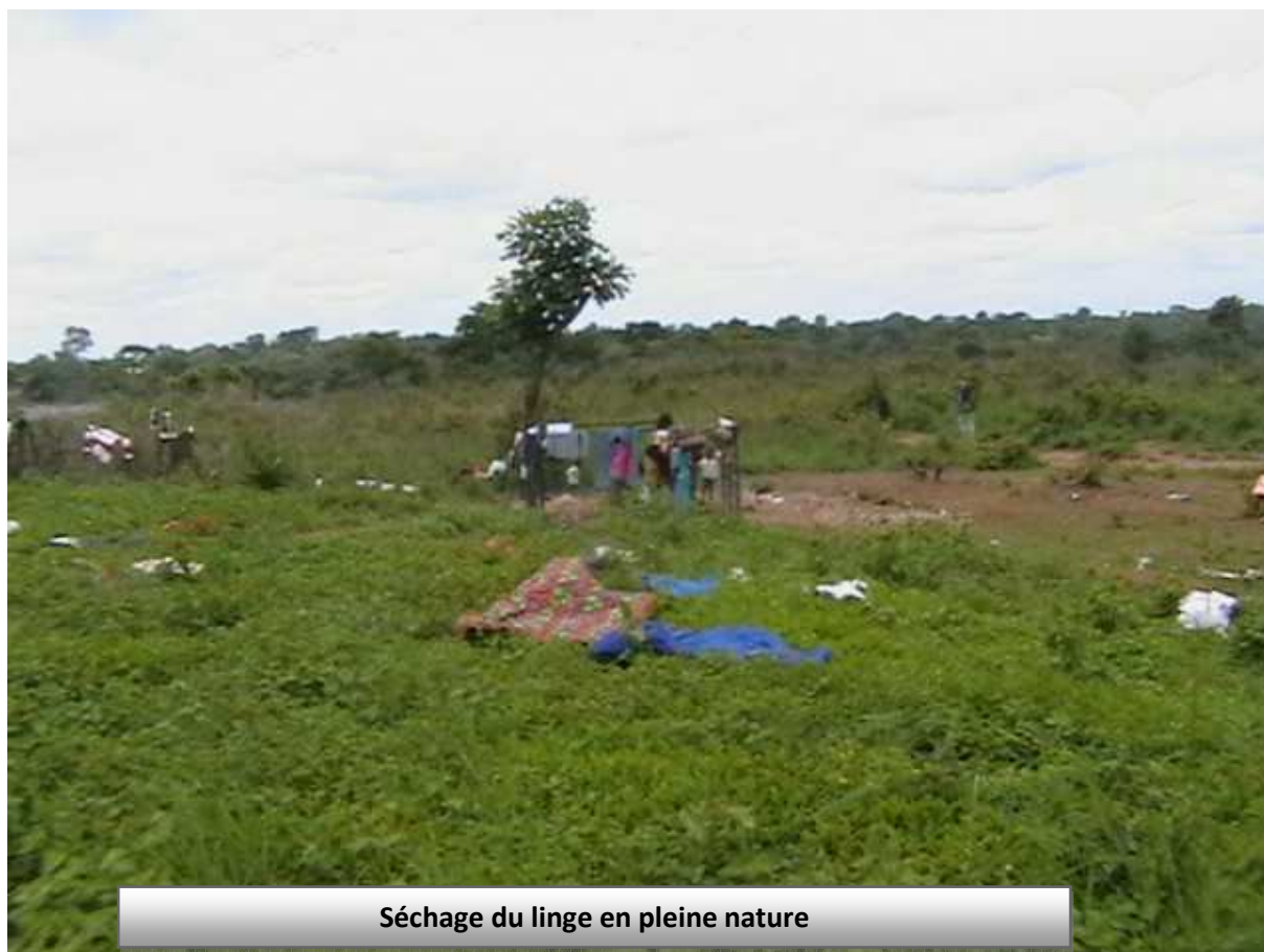
Séchage du linge en pleine nature

Projet d'Urgence en Eau, Assainissement Promotion l'Hygiène en faveur des Réfugiés Centrafricains dans le Camp de Nandoungué, Région de l'Est – Cameroun