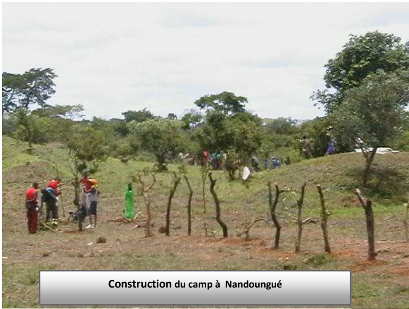
Construction du camp à Nandougué