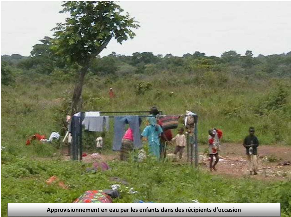
Approvisionnement en eau par les enfants dans des récipients d'occasion

Sa construction va se dérouler en 01 semaine après attribution du marché. L'équipe d'Afrique Solidarité Suisse, en étroite collaboration avec la section WASH de la Sous Délégation UNHCR de Bertoua va sélectionner une entreprise qualifiée selon la procédure d'urgence en la matière. La construction du forage devra respecter les caractéristiques requises pour satisfaire les standards de qualité et de quantité. Pour cela, l'entreprise devra réaliser un forage d'un débit moyen de 3 m 3 /Heure et procéder aux analyses physico-chimiques et bactériologiques des échantillons d'eau prélevés dans ce forage. Après équipement, l'entreprise devra procéder à la chloration du forage pour éliminer les éventuels risques de contamination post construction.