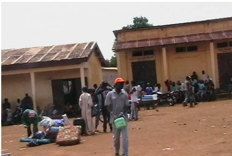
Installation des réfugiés à l'école primaire de Garoua Boulai