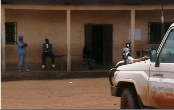
Le chef de la sous-délégation de l'UNHCR de l'Est sur les lieux à l'école de Garoua Boulai

Entre le 25 et le 31 Mars 2013, près de 1 150 réfugiés y ont été reçu par les autorités camerounaises, l'UNHCR et la Fédération Internationale des Sociétés de la Croix Rouge et du Croissant Rouge (FICR).