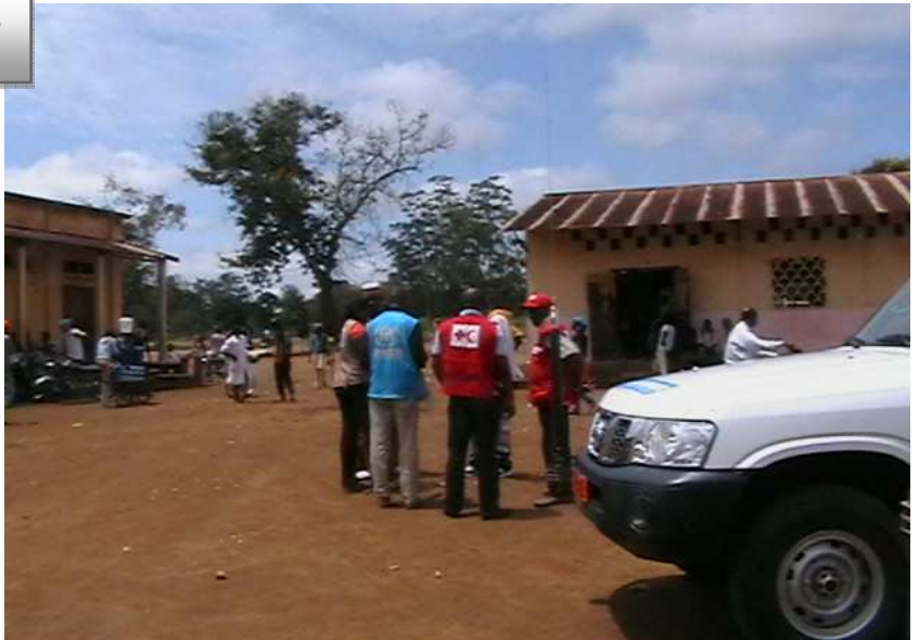
Réunion de concertation entre les partenaires et l'UNHCR sur les lieux à l'école de Garoua Boulai

La ville de Garoua Boulai, située dans la région de l'Est – Cameroun est le site qui a connu le plus grand nombre d'arrivées.