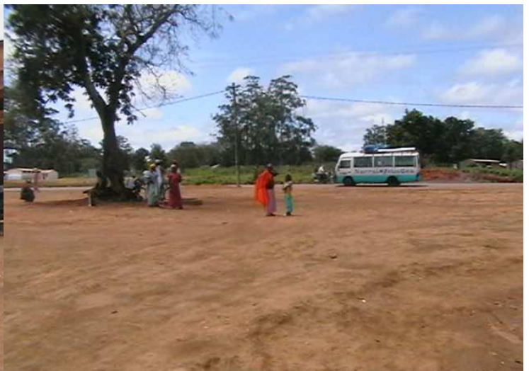
Véhicule de transport de Garoua Boulai à Noundougué